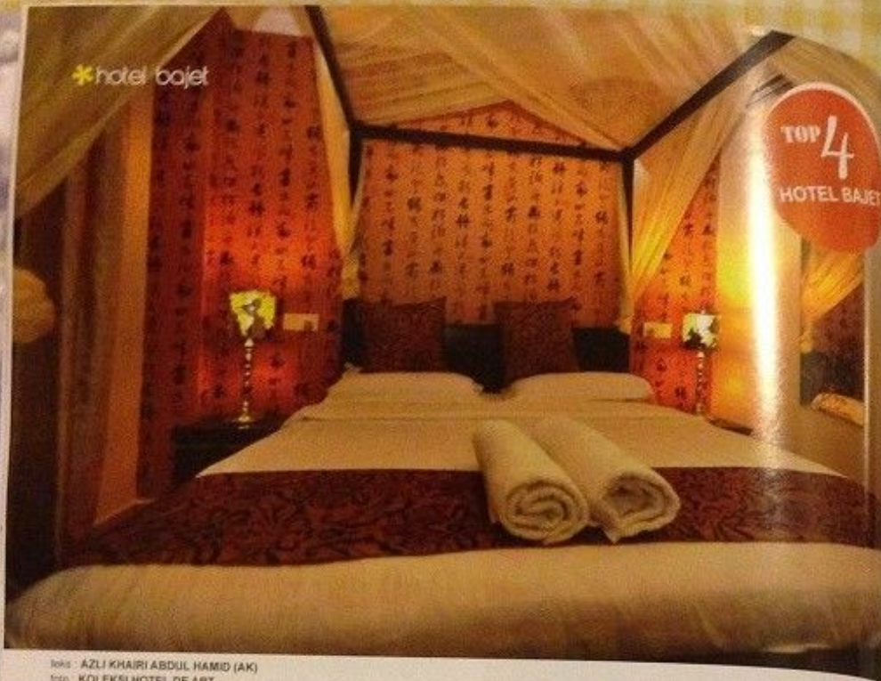
Ilustrasi: AZLI KHAIRI ABDUL HAMID (AK)